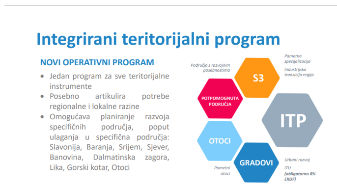
Slika 1: Prikaz integriranog teritorijalnog programa

Zahvaljujući novostima iz Kohezijske politike u novom programskom razdoblju JLS mogu očekivati više sredstava za lokalni razvoj, veću integraciju ulaganja iz različitih izvora, daljnji razvoj teritorijalnih instrumenata te veću fokusiranost i poseban cilj politike posvećen lokalnom razvoju s naglaskom na zeleno i digitalno.